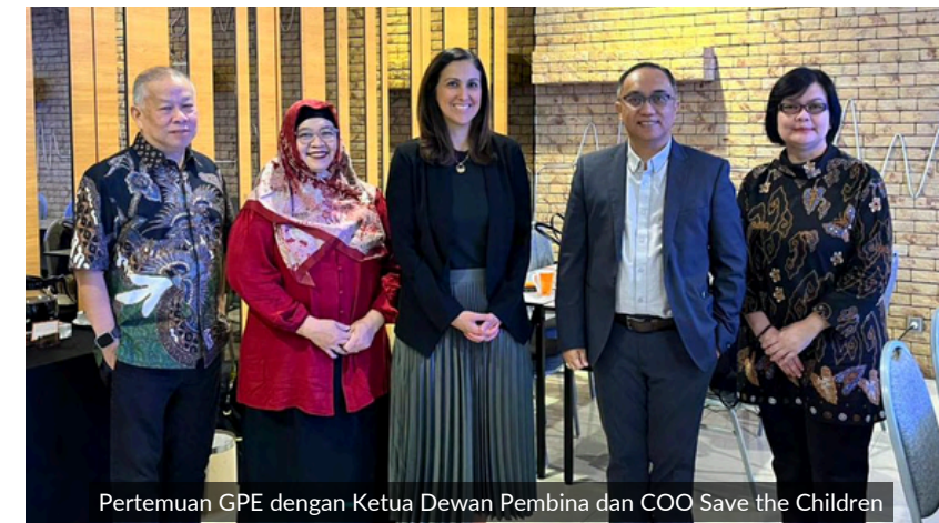
Pertemuan GPE dengan Ketua Dewan Pembina dan COO Save the Children