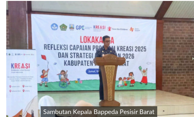
Sambutan Kepala Bappeda Pesisir Barat