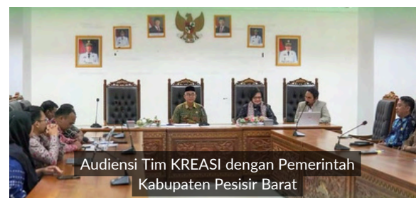
Audiensi Tim KREASI dengan Pemerintah Kabupaten Pesisir Barat

Rangkaian kegiatan kemudian dilanjutkan di Kabupaten Pesisir Barat. Pada 5 Maret 2026, tim KREASI mengadakan rapat koordinasi bersama Pemerintah Kabupaten Pesisir Barat yang dipimpin Asisten Setda Pesisir Barat dan dihadiri Kepala BGTK Lampung. Pertemuan ini membahas sinergi antara program KREASI dan prioritas pembangunan daerah, serta peluang integrasi program dalam perencanaan pembangunan pendidikan di tingkat kabupaten.