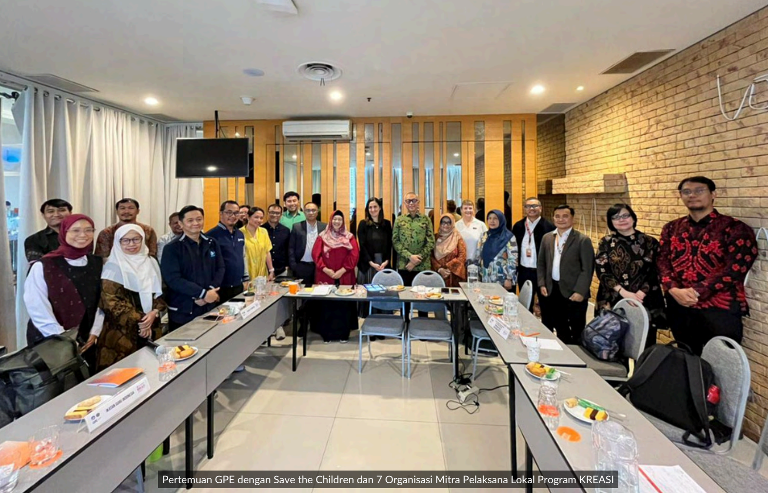
Pertemuan GPE dengan Save the Children dan 7 Organisasi Mitra Pelaksana Lokal Program KREASI