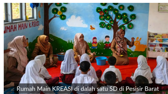
Rumah Main KREASI di dalam satu SD di Pesisir Barat