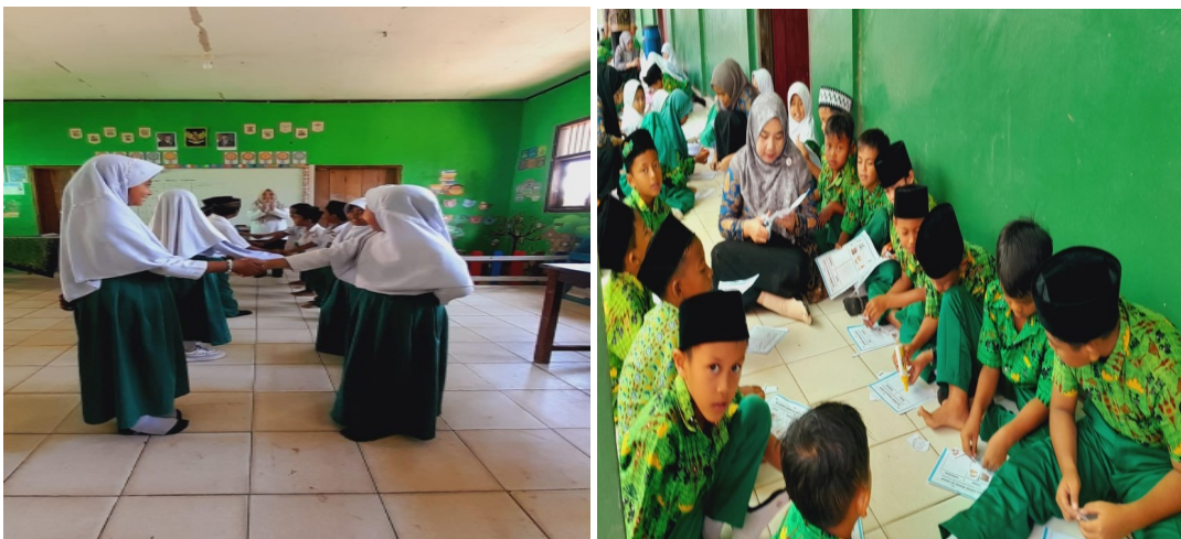
Gambar 6. Mendongeng

Berdasarkan hasil wawancara dengan guru menyatakan bahwa mendongeng memiliki dampak besar dalam meningkatkan minat siswa terhadap membaca dan mendengarkan. "Mendongeng memicu rasa ingin tahu siswa. Mereka menjadi tertarik untuk mendengar cerita dan ingin mengetahui kelanjutan kisah yang dibacakan. Hal ini mengarah pada minat baca yang lebih besar," ujar kepala sekolah tersebut. Mendongeng memanfaatkan kekuatan cerita untuk menarik perhatian siswa, yang selanjutnya mendorong mereka untuk membaca buku dengan lebih antusias.