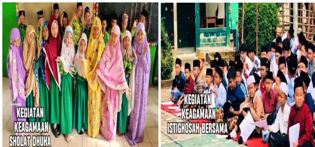
Gambar 8. Kegiatan keagamaan sholat Dhuha dan Istighosah bersama

Di samping itu, kegiatan kelompok yang melibatkan kerja sama antar siswa juga membantu mereka untuk mengembangkan sikap saling menghargai, tanggung jawab, dan disiplin. Dalam pengamatan, siswa menunjukkan perilaku yang lebih positif, dengan dilakukannya kegiatan keagamaan secara rutin. Kegiatan ini memberikan kontribusi yang signifikan dalam membentuk karakter siswa sesuai dengan nilai-nilai yang diinginkan dalam pendidikan karakter di daerah ini.