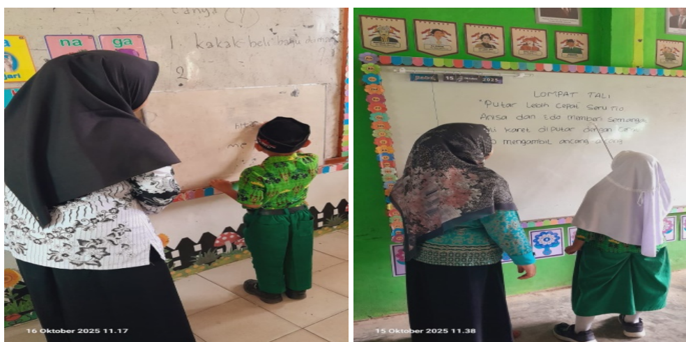
Gambar 3. Klub bermain Literasi dan Numerasi (CUC)

Berdasarkan hasil wawancara dengan guru yang menyatakan bahwa Klub Bermain Literasi dan Numerasi (CUC) sangat berperan dalam meningkatkan minat baca siswa. "Dengan pendekatan berbasis permainan, siswa menjadi lebih antusias dan tidak merasa terbebani saat belajar. Mereka lebih termotivasi untuk membaca buku dan belajar matematika melalui permainan yang menyenangkan," Program ini mengintegrasikan kegiatan literasi dan numerasi yang menyatu dalam permainan yang menghibur dan mendidik.