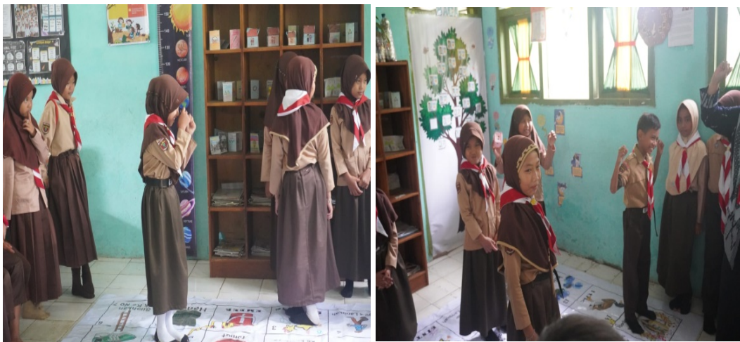
Gambar 5. Ular Tangga

Berdasarkan hasil wawancara dengan guru menyatakan bahwa permainan ular tangga sangat efektif dalam meningkatkan minat siswa untuk belajar. "Siswa lebih tertarik untuk belajar ketika mereka dapat bermain sambil belajar. Dengan menggunakan permainan ular tangga, mereka merasa seperti sedang bermain, tetapi mereka juga belajar tentang kosakata, membaca, dan berhitung. Permainan ini sangat menarik bagi mereka," ujar kepala sekolah tersebut. Dengan pendekatan yang menyenangkan, siswa lebih termotivasi untuk berpartisipasi aktif dalam kegiatan literasi.