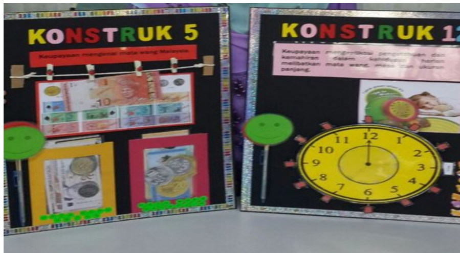
Gambar 9. Alat Peraga Numerasi

Dalam alat peraga numerasi, siswa diberi kesempatan untuk berinteraksi mempraktekkan alat peraga numerasi tersebut dan mampu menjawab soal-soal matematika yang menantang. Kegiatan ini membantu siswa untuk memvisualisasikan konsep-konsep numerasi yang kadang sulit untuk dipahami jika hanya dijelaskan secara verbal. Dalam pengamatan, siswa yang terlibat dalam kegiatan ini menunjukkan peningkatan pemahaman yang signifikan dalam hal mengenali angka dan melakukan perhitungan sederhana.