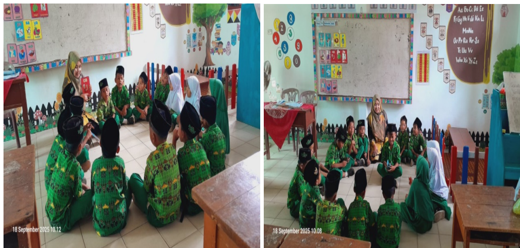
Gambar 4. Membaca Nyaring

Sebagian besar guru menyatakan bahwa kegiatan membaca nyaring memberikan dampak positif terhadap pemahaman teks oleh siswa, serta meningkatkan keterlibatan mereka dalam aktivitas literasi di kelas. Salah satu kepala sekolah menyatakan, “Metode membaca nyaring ini membuat siswa lebih bersemangat dalam memahami bacaan, karena mereka bisa berdiskusi bersama teman-teman sekelas.”