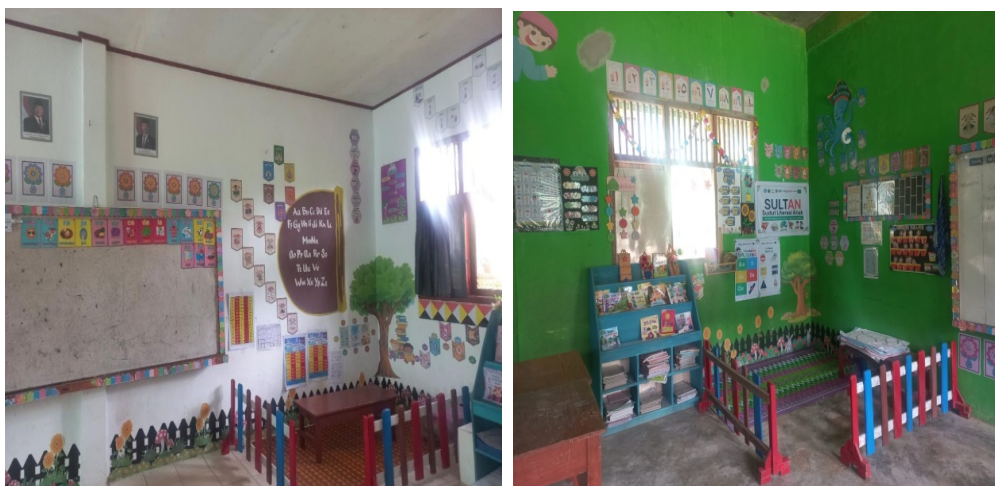
Gambar 2. Pojok Sultan